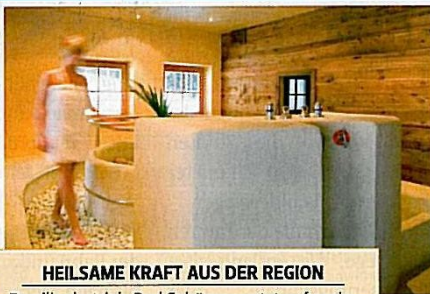
9 HEILSAME KRAFT AUS DER REGION Familienbetrieb Bad Schörgau setzt auf regionale Schätze wie Latschenkiefernöl, Heubäder, Kneippbecken und die eigene Wellnessküche.